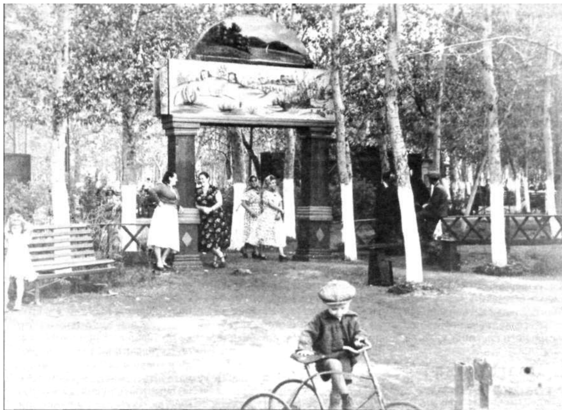
Парк в Старом городе

- В 1909 году на переселенческом участке Жауыр-Брод был образован поселок Самаркандский. Жителями поселка были немецкие семьи, прибывшие из центральных районов