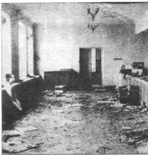
Разгромленный гастроном. Слева и снизу – архивные фотографии, предоставленные городским музеем, справа – нынешний вид здания.