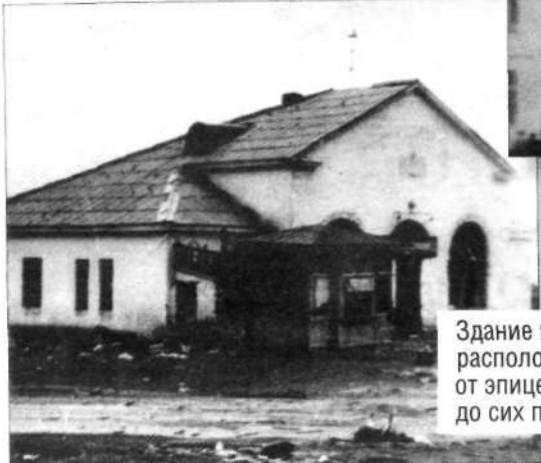
Здание магазина, расположенного недалеко от эпицентра беспорядков, до сих пор стоит.