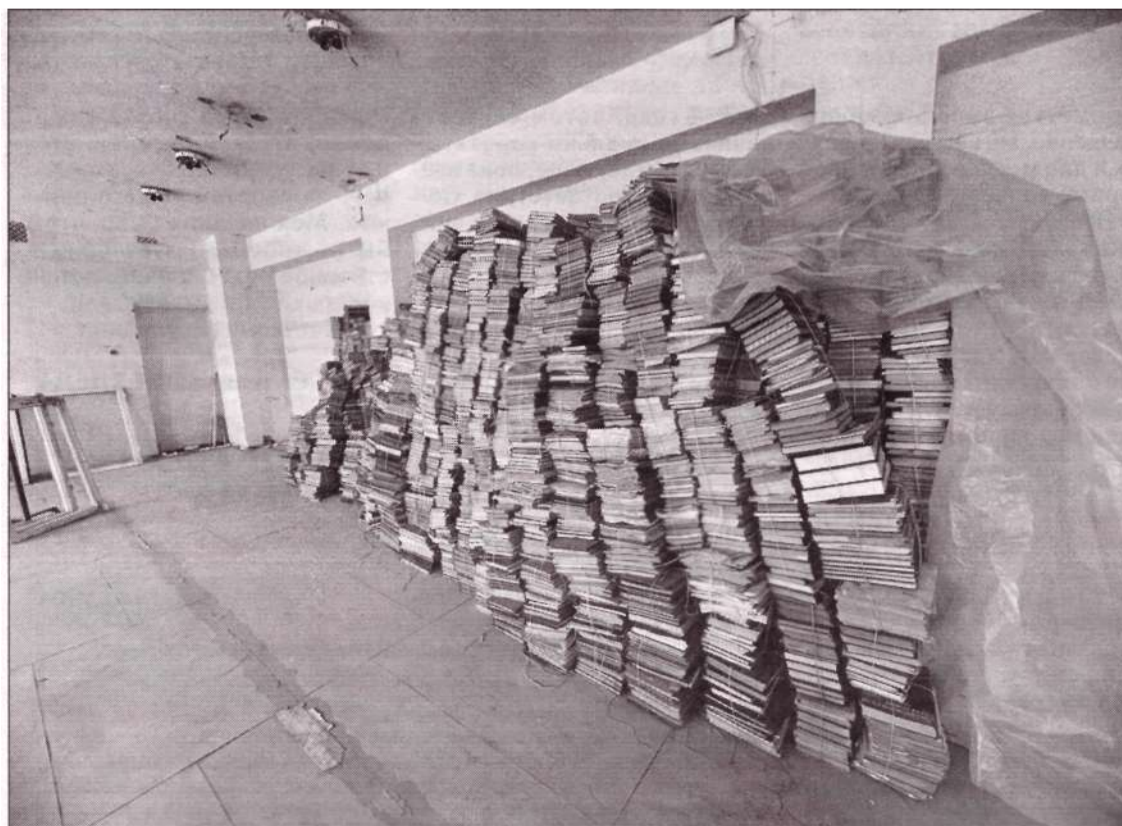
Сколько книг сейчас в возрождающейся технической библиотеке, сказать сложно. Только в библиотеке предприятия «Практика-Т» было 14 тысяч экземпляров. Но пока что поступления некому считать и систематизировать