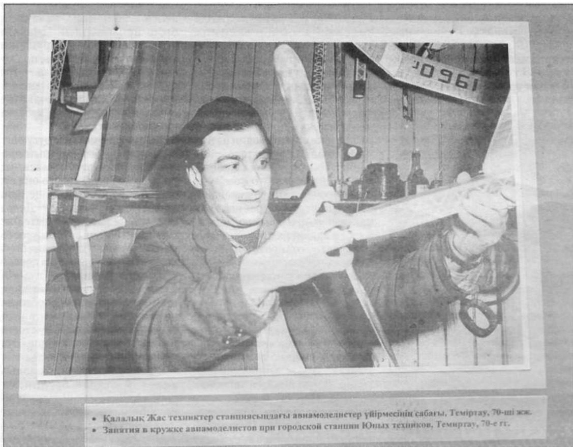
• Калалык Жас техниктер станицасындағы авиамodelистер үйірмесінің сабағы, Темиртау, 70-ші жж. • Занятия в кружке авиамodelистов при городской станции Юных техников, Темиртау, 70-е гг.