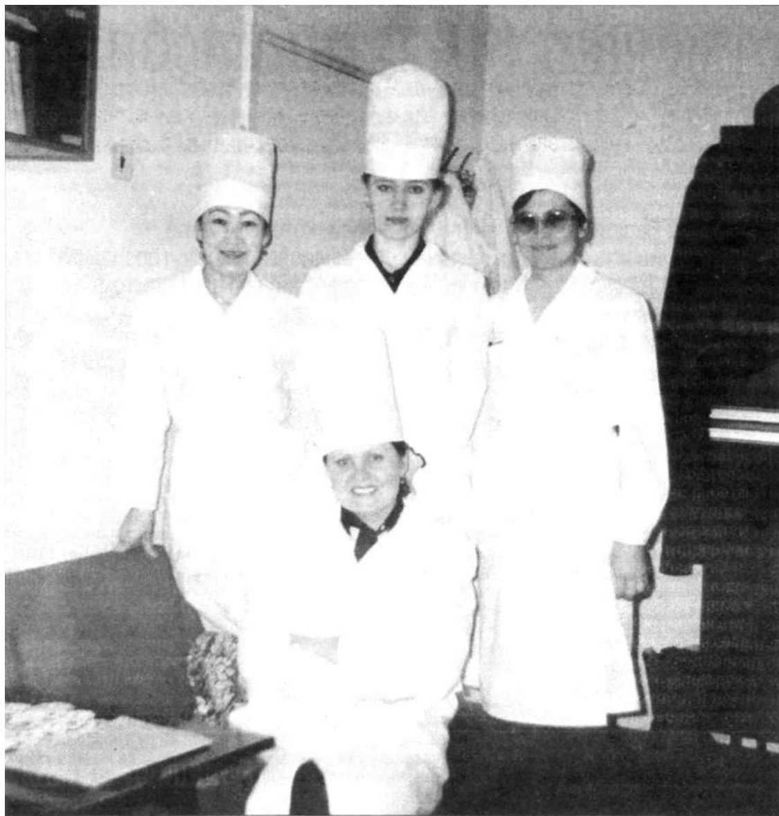
90-е годы. С молодыми специалистами

- Когда на меня смотрят более молодые коллеги, они, наверно, считают, что я ничего не боюсь. А я им всегда говорю: я не считаю себя умной - я просто долго живу и многое видела (Улыбается.) Хотя бывает, встречается и