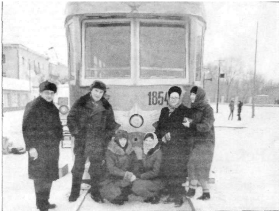
Один из съемочных дней, на фоне восстановленного трамвая.