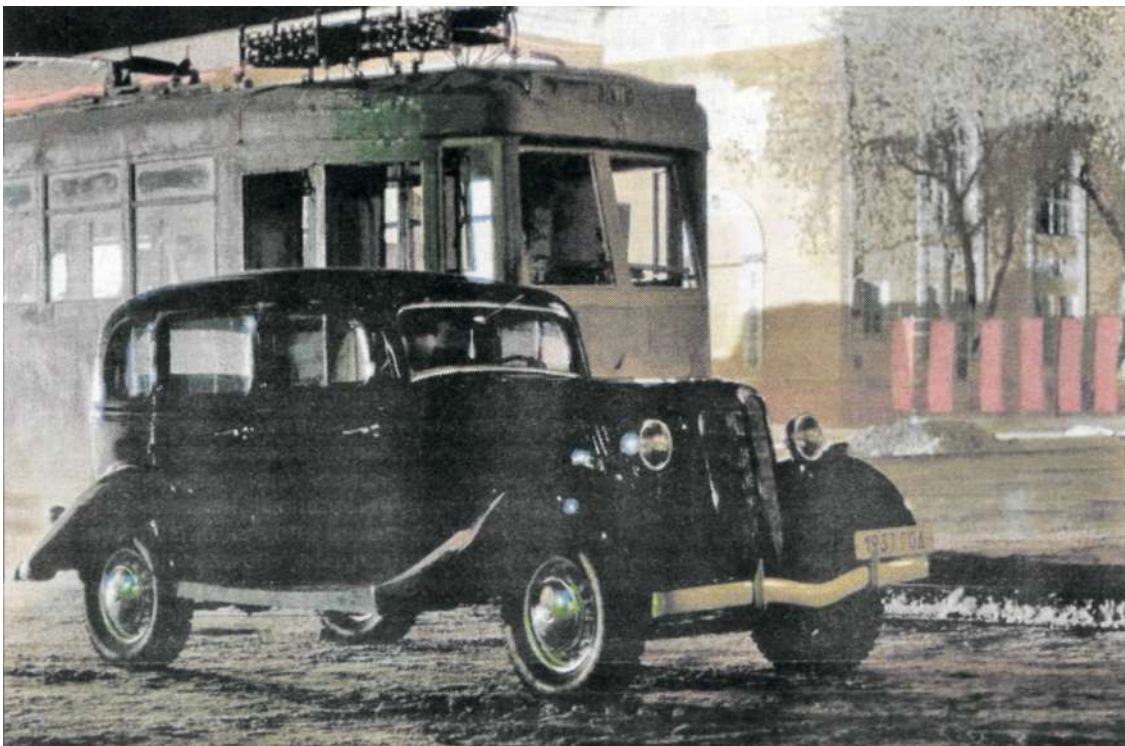
Автомобиль, задействованный в съемках.

Пятиметровую статую Сталина, которую так хорошо видно в фильме, сделали из пенопласта. Кстати, специально для фильма в Темиртау привезли из Алматы сразу 46 гипсовых бюстов вождя народа - от самого маленького в 60 см до 1,5-метрового. Их в течение месяца ваяли алматинские скульпторы. Все эти скульптуры делали для съемок одной сцены в ДК энергетиков, и они были гифе бутафорские - выполнены по технологии, которая используется при изготовлении скульптур из гипса, а потому очень тяжелые. Например, при разгрузке одну из «голов» Сталина не могли нести даже шесть мужчин!