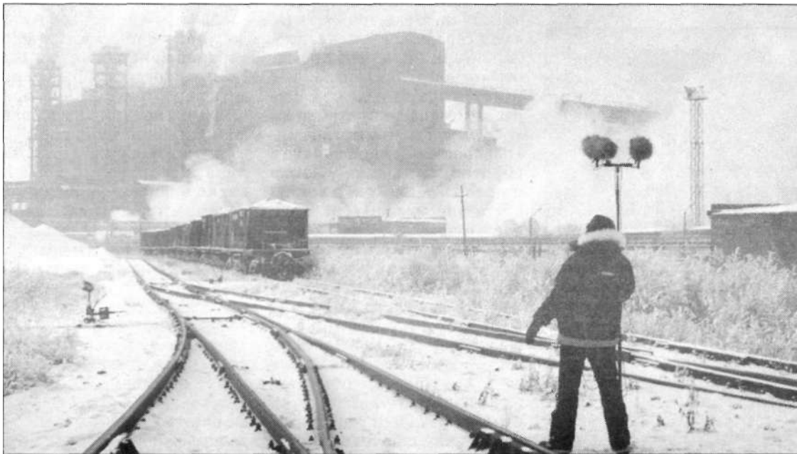
На съёмках «Пыль времен» в Темиртау. 2007 год

Напомним, по сюжету молодые люди встретились в Греции, расстались и вновь ненадолго столкнулись в Советском Союзе, да еще в день,