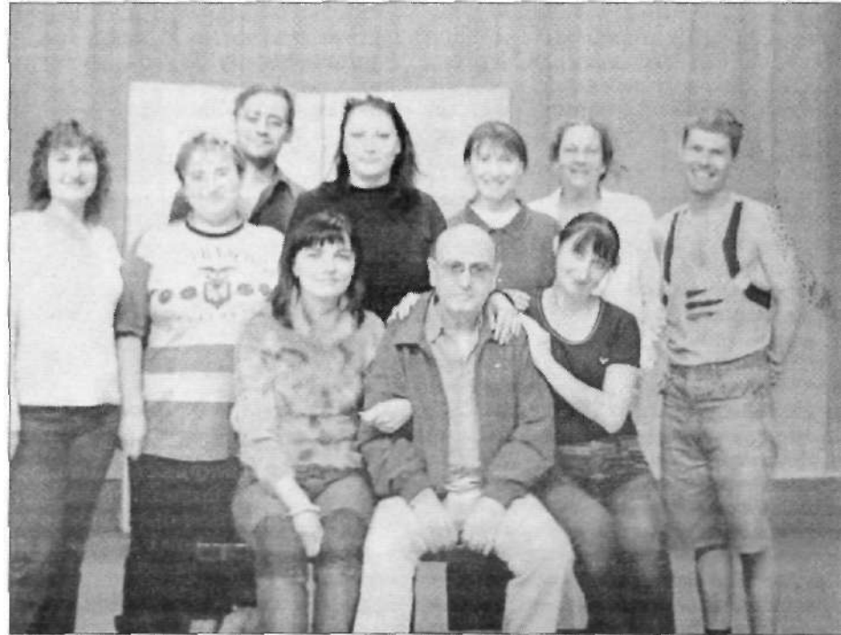
Труппа темиртауского театра с Тео Ангелопулосом (первый ряд, в центре).