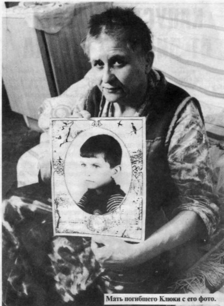
Мать погибшего Ключки с его фото.